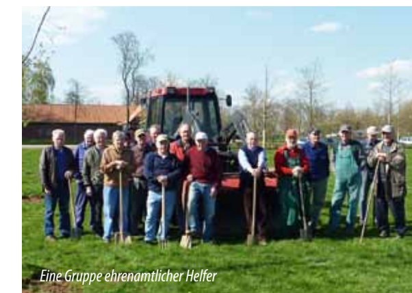
Eine Gruppe ehrenamtlicher Helfer

Für jeden Geldeingang erhalten Sie eine Zuwendungsbestätigung, die Sie steuermindernd geltend machen können (bitte deshalb Name und Anschrift bei der Überweisung nicht vergessen).